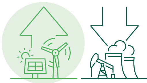
Cynyddu cynhyrchiant adnewyddadwy, lleihau'r defnydd o danwydd ffosil

Sut rydyn ni'n mynd i'r afael â'r heriau hyn